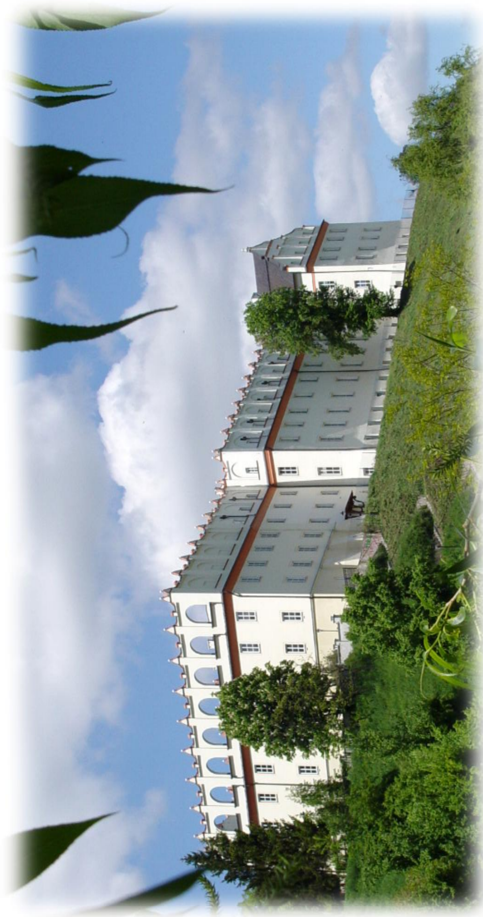
Collegium Gostomianum 1602 r.