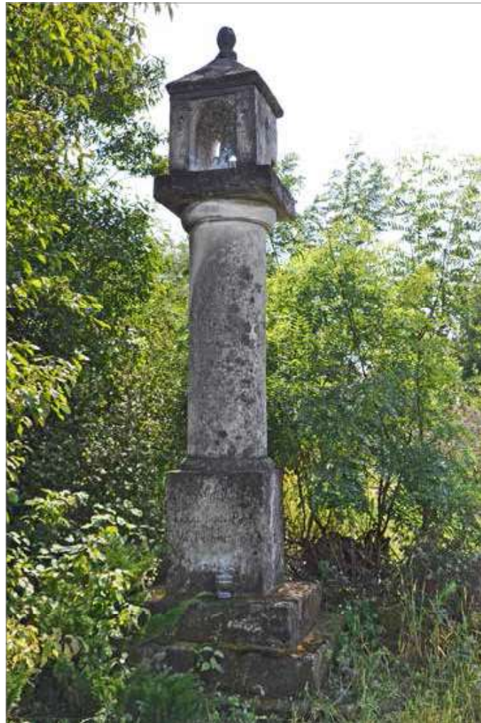
Figura Chrystusa Frasobliwego wzniesiona 18 września 1824 r., usytuowana na wzgórzu w domniemanym miejscu bitwy pod Zawichostem w 1205 roku, gdzie rycerstwo polskie pokonało siły ruskie księcia Romana halickiego. Znajduje się na skraju wyżyny biegnącej od Winiar do Zawichostu (obok stacji przekaźnikowej).