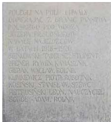
Tablica poświęcona siedmiu poległym w wojnie polsko-bolszewickiej w latach 1919-1921.